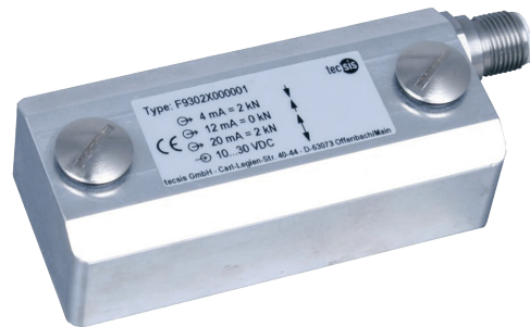
Тензодатчик деформации, модель F9302

Датчик деформации подходит для использования в конструкциях с растяжением или сжатием макс. 1,0 % и обеспечивает суммарную погрешность измерительного прибора 2 % от полного диапазона измерения. Для крепления прибора к области конструкции, в которой происходит относительное удлинение, используются два болта. Датчик деформации имеет встроенный усилитель. Узел "деталь конструкции/датчик деформации" можно легко отрегулировать с помощью сигналов управления.